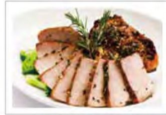
豚肩肉のガーリックロースト