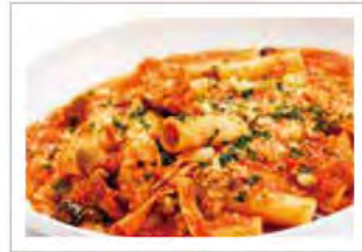
豚中味とリガトーニのトリッパ風

昔から「豚は鳴き声以外すべて食べられる」と言われるほど豚肉文化が根付く沖縄ならではの、部位ごとに様々な方法で料理した豚肉を丸ごと楽しめるディナーブッフェ。洋食ならではの調理法である赤ワイン煮・ロースト・コンフィ・テリーヌ・スモーク・フライ・パスタ等で豚肉の魅力をお楽しみください。もちろん人気のズワイガニも食べ放題でご準備しております。