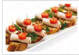
豚ロースの自家製燻製ハム