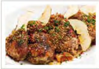
豚はほ肉のコンフィ