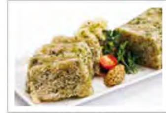
ミミガーのテリーヌ