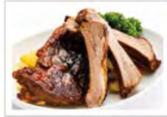
ボークスベアリブ